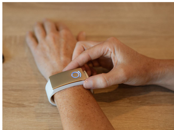
Figure 3. Dispositif Remedee Well, www.remedee.com , source Remedee Labs SA.

Ce même mécanisme est envisagé dans d'autres pathologies [4] comme les douleurs pelvi-périnéales, les troubles fonctionnels intestinaux, certaines formes de céphalées chroniques et plus récemment dans les symptômes persistant du COVID [48,49]. Cette composante nociplastique peut également être associée à des pathologies chroniques douloureuses où les composantes nociceptives (arthrose, rhumatisme inflammatoire) ou neuropathiques dominant