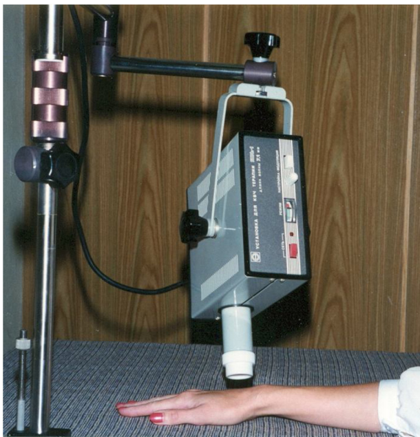
Figure 1. Dispositifs d'émission d'ondes millimétriques utilisés en clinique-Modèle Yav-1.

autorités de l'époque, ayant permis la prise en charge de millions de patients [1,8]. De faible puissance (10 mW/cm 2 ) et appliquées de façon externe et très localement, ces traitements ne montraient aucun effet adverse.